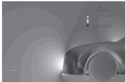
図 3：最大圧力点周辺の圧力分布