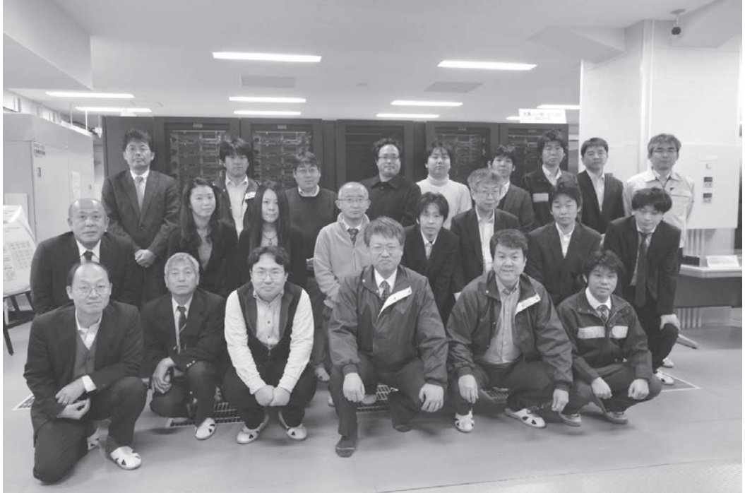
写真1 運用を終了した T2K 東大と情報基盤センター、日立製作所のメンバー

2014年3月10日午前9時をもって、HA8000 クラスタシステム (T2K 東大) (ピーク性能 140.1 TFLOPS) は運用を終了いたしました(写真1)。2008年6月2日の運用開始以来、5年9ヶ月、長い間ご愛用いただきありがとうございました。