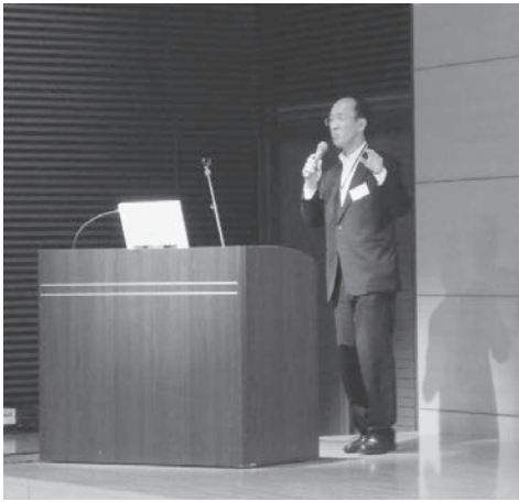
榎本文部科学省研究振興局参事官（情報担当） による来賓挨拶