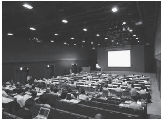
発表および会場内の様子